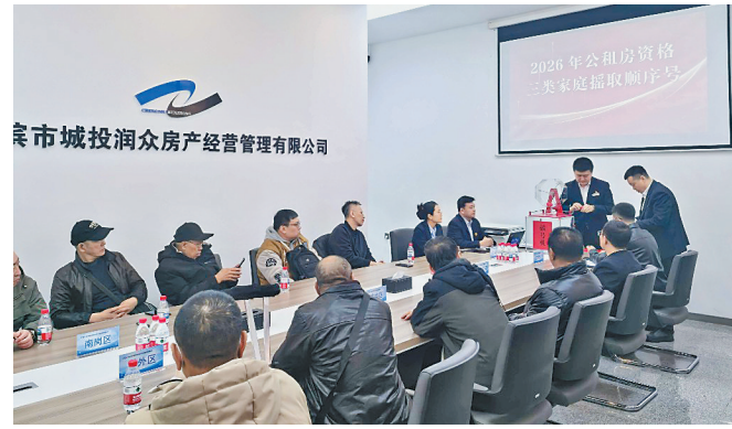
哈市城投润众房产经营管理有限公司

生活报讯24日上午,哈市2026年公租房资格三类家庭公开摇号配租。本次参加摇号顺序号的公租房资格三类家庭共928户,通过先公开摇号顺序号,再按照顺序号选房的方式进行配租;本次摇号配租包括群力新苑、格兰云天、河畔花园等82个小区的1100套房源,月租金为使用面积0.35元/平方米。