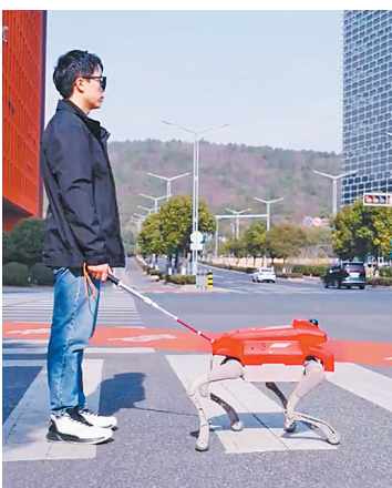
生活报讯(记者吕晓艳)2日,哈尔滨工业大学公布最新科研成果,该校研制的智能导盲犬“小苏”将从实验室走进百姓生活。

据悉,智能导盲犬小苏拥有语音交换、场景及地形识别、智能避障、定向导航等功能。可以精准的语音交互,整机重15公斤以内,方便视障人士携带。电梯开门时,小苏会及时带领视障人士进入电梯,出门下台阶时会发出提示“前方有台阶,请小心”,定位精度控制在10厘米以内,在视障人士过马路出现绿灯时,会立即提示:“前方绿灯,可通行。”