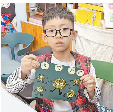
与志愿者组成宣传队伍,沿马家沟堤开展文明祭扫宣讲。工作人员向居民发放宣传单,细致讲解清明节的由来与传统习俗,重点推介鲜花祭扫、网络祭扫、家庭追思等绿色文明祭扫方式。

生活报讯(记者于海霞)在清明节来临之际,哈尔滨市香坊区建筑街道三合社区组织开展“五谷杂粮拼贴画”创作与文明祭扫宣传系列活动。活动筹备阶段,社区工作人员提前精选绿豆、红豆、小米等色彩多样、颗粒饱满的五谷杂粮,同时备齐画纸、胶水、画笔等创作工具。活动现场,童趣盎然、气氛热烈。小朋友们在家长与志愿者的耐心指导下,充分发挥想象力与创造力,指尖翻飞间将一粒粒杂粮巧妙拼贴。大家紧扣“清明”“思念”“感恩”“绿色”主题,创作出青团、清明花束等充满传统寓意与情感温度的图案。与此同时,社区网格员