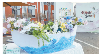
风车祈福、家书传情……