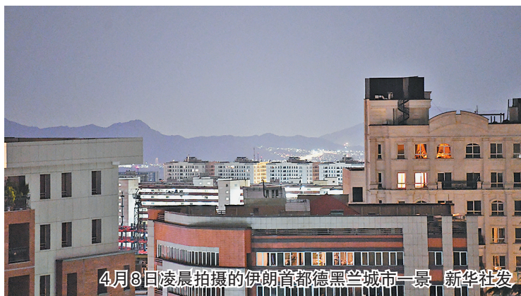
4月8日凌晨拍摄的伊朗首都德黑兰城市一景。

据报道,巴基斯坦就伊朗问题提供的意见受到美方重视。特朗普说,巴基斯坦“比大多数国家”更了解伊朗,近来还转发了夏巴兹的帖文。特朗普还说巴陆军参谋长穆尼尔是他“最喜爱的陆军将领”。分析人士说,穆尼尔与美国和伊朗同时保持良好关系。