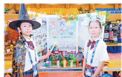
事“活”起来,适合擅长表达、热爱舞台的“小演员”。

3.科学展演:结合画报创作与现场讲解,既考验动手能力,也锻炼语言表达能力,综合考察科学素养。