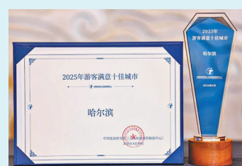
位守护游客出行体验。

在服务方面,哈尔滨强化统筹协调,系统实施冬季冰雪、夏季避暑两个旅游“百日行动”,依托文化旅游工作联席会议统筹60个成员单位构建高效联动的工作格局。聚焦旅游全要素服务保障,推出地铁区间免费摆渡、景区温暖驿站、商家姜茶暖贴、饭店小份菜品、市民爱心接驳等暖心服务,以制度刚性保障服务温度,全方