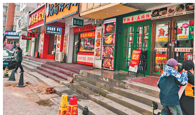
坍塌的台阶 商家提供

生活报讯(记者仲亮文/摄)11日,哈尔滨市松北区志华商城一处商服门前台阶发生坍塌,坍塌造成地面变形,商服房门无法正常开启,事件未造成人员伤亡。受此影响,该商户五天无法正常经营,处于停业状态。