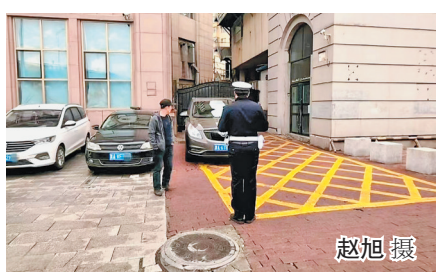
排查现场向周边居民、商户普及消防通道管理法律法规,讲解占用“生命通道”的现实危害,提升群众消防安全意识。

程,23-24日气温明显回升,24日白天最高气温全市普遍达18~21℃;其他时段最高气温在9~13℃,最低气温在-3~3℃。本周哈市大风日数较多。20日白天至22日白天全市平均风力4~6级,阵风7~8级,其中21日白天山区、半山区或开阔地带最大阵风可达9级;大风时段局地伴有浮尘或扬沙,能见度转差。23-26日风力有所减小,白天平均风力以3~4级为主,但阵风可达5~6级,夜间平均风力3级以下。