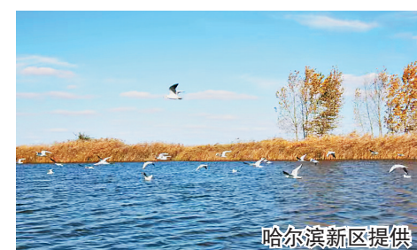
植物240余种,形成百亩塔头、千亩柳条通、万亩荷花塘的特色景观。

记者了解到,该园区地处松花江哈尔滨主城区左岸,位于四环桥与三环桥之间的滩地上。园区三面环水、河湖相通,水陆相连、生境多样、物种丰富。在人工辅助与自然演替共同作用下,已恢复陆生、砂生、湿生、水生