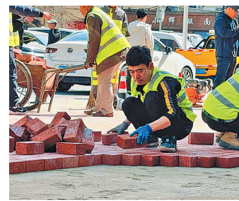
工程质量。同时,严格执行“即查即修、快修快复”工作机制,科学规划施工流程,最大限度降低施工对市民生活的影响。

施工期间,哈市道路桥梁工程处严把工程质量关与施工标准关,维修选材全面采用通体人行道板,有效降低冻融风化影响,大幅提升人行道防滑、耐磨、耐用性能;维修工艺优化采用干硬性砼加固基础、调平层铺设水泥干拌砂的施工方方案,全方位提升道路修复