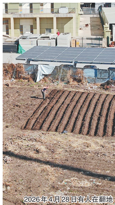
2026年4月28日有人在翻地

2026年4月28日上午,生活报记者接到市民反映后来到现场。从围挡外侧和霓虹桥上往下看,整片空地被人用一道道土棱划分出十几块大小不一的区域,部分地块的泥土明显刚被翻过,颜色发黑,表层还带着浇水后未干的痕迹。 一位路过的市民向记者描述了前几天看到的情景。他说,当时看到有人在地里弯腰忙活,就上前询问,对方回答:“地空着也是空着,种一年算一年。” 随后记者就这一情况联系了管护单位哈尔滨市交通基础设施投资建设管理有限公司。29日,该公司安全运营部副部长张先生回复说:“这块地我们是要合作经营,正在筹划中。28日晚上,我们连夜就对这块地进行了平整,并做了公示板挂在大门上。” 这片空地的问题存在已有一段