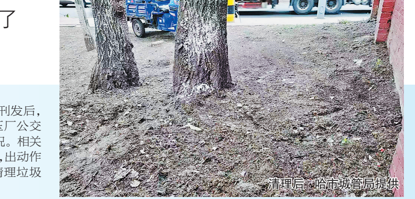
清理后,哈市城管局提供

生活报讯(首席帮办记者李丹文/摄)6日,有市民反映哈市220路通用液压厂公交站附近,绿地内环境卫生脏乱,各类垃圾随意丢弃,严重影响市容环境与居民观感。 当日,帮办记者来到现场实地探访发现,该区域确实存在绿化带内垃圾堆积、杂物混