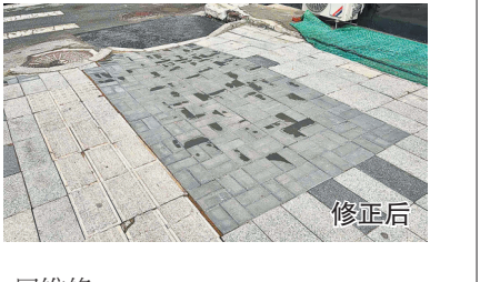
展维修。帮办记者6日在现场看到,路面原本裸露区域破损地砖已清理完毕。

生活报讯(首席帮办记者李丹文/摄)4月30日,本报报道了哈市南岗区吉林街41-1号门前的人行道出现破损,地砖碎裂、有土裸露,给过往行人通行带来不便,还埋下安全隐患,希望相关部门尽快处置。 哈市道桥中心收到线索后,立即督办该区域道路设施管护单位进行处置,同时派出外业工作人员到达现场实地踏查。随后,哈市道桥中心协调南岗区城管部门,派遣维修队伍开