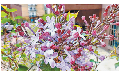
在同一城区内,丁香开花也存在先后之分。

文/摄影生活报记者 李丹 6日,暮春初夏,花香渐浓,作为哈尔滨市花的丁香,已悄然拉开绽放帷幕。目前,三大动力路等多条街路上,记者看到,紫丁香率先吐露芬芳,一片片花团锦簇缀满枝头,用馥郁花香与烂漫花姿,生动注解着“丁香之城”的独特浪漫,不少市民漫步街头,沉浸式感受这份专属冰城的春日美好。 记者在走访中了解到,哈市街头开放的丁香以紫丁香为主,微风拂过,细碎的花瓣随风摇曳,淡雅的香气弥漫在街巷之中,让整座城市都萦绕着温柔的氛围感。据园林部门工作人员介绍,受今年气温变化影响,今年丁香整体绽放时间较去年稍有推迟。同时,由于城市不同区域光照、温度与湿度存在差异,即