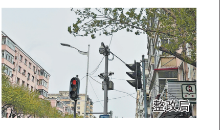
进行修剪清理,及时消除路口交通安全隐患,当日处置完毕。

生活报讯(首席帮办记者李丹文/摄)4月30日,本报报道了哈市南岗区吉林街与民益街交口处,部分交通信号灯被行道树枝干遮挡,影响视线,存在交通安全隐患一事。 报道刊发后,南岗区城管局园林绿化养护中心工作人员第一时间赶赴现场。5月6日,帮办记者到现场看到,工作人员对遮挡信号灯的枝条