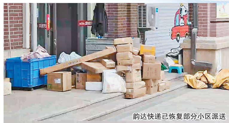
韵达快递已恢复部分小区派送

随后记者联系到一位申通快递的工作人员了解情况,其表示,哈西地区的快递网点为个人加盟经营,规模较大,与多家快递公司都签了合同,负责该区域中通、申通、圆通、韵达、极兔快递的分拣与转运。目前该网点产生了经营纠纷,无法继续运营,造成多家快递均无法收发货物。