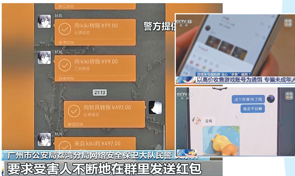
广州市公安局荔湾分局网络安全保卫大队民警要求受害人不断地在群里发送红包

据央视新闻客户端报道 在互联网深度融入生活的当下,针对未成年人的电信网络诈骗手段层出不穷,其中以游戏账号、装备交易为名的骗局,正在成为新型诈骗陷阱。不法分子将未成年人视作待宰的“鱼”,以高价收售游戏账号为诱饵,布设“杀鱼”诈骗套路,利用虚假交易平台、屏幕共享等手段骗取钱财。近期,广东广州警方成功捣毁一个专门针对未成年人的“杀鱼”式网络诈骗团伙。