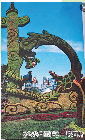
《金龙盘玉柱》 资料片

记者了解到,栽植环节最耗人力、最考验功力,熟练技工一小时仅能完成1.5-2平方米的五色草栽植。技工以木圆头锥子扎孔、栽草、压实,随栽随修剪,避免二次返工。五色草栽植程序分工高度专业化,美工在定型的泥胎表面精准画好图案,技工按图案分别栽植不同颜色的草,还有专人进行精修剪(又叫“打剪子”),在两种颜色的草的交界处剪出流畅的线条和立体感,每个环节衔接紧密,层层把关。