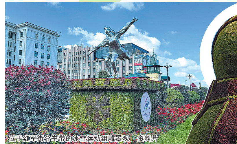
位于红军街分车带的冰雪运动组雕景观 资料片