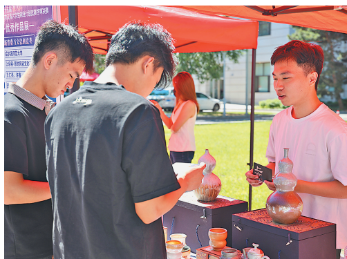
赛前置成果转化环节,推动更多优秀项目在落地转化中脱颖而出。

活动现场还安排了投融资对接活动,科力公司等7家风创投机构和来自哈尔滨工业大学、哈尔滨工程大学等高校的10个优质项目进行了路演对接,此次比