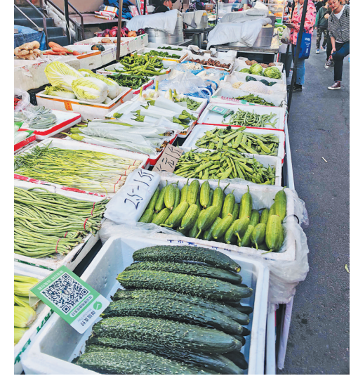
生活报讯15日,记者从国家统计局黑龙江调查总队获悉,5月份,我省居民消费价格总体平稳运行,同比上涨1.5%,与上月涨幅持平;环比下降0.2%,其中,受气候转暖影响,鲜菜价格大幅下降14.9%,带动食品烟酒及在外餐饮类价格环比下降0.7%。