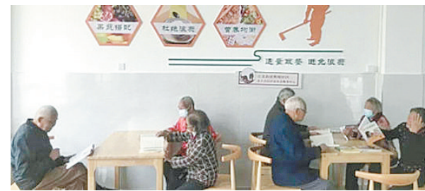
同时,东阳市投入4.68万元用于救助站设备购置,改善流浪乞讨人员的生活质量,提供更加安全、高效、人性化的救助服务。据了解,所有项目均已按计划实施。据中国福彩微信公众号

补助;投入14.98万元开展精康融合服务,规范服务精神障碍患者1000人次;投入51.37万元为低保、低边、特困等困难老年人提供生活帮扶与精神关爱服务,服务困难老人5725人。 在残疾人服务方面,投入42.6万元对符合条件的残疾儿童进行康复服务训练补贴,受益残疾儿童186人;投入36.2万元保障20家“残疾人之家”机构运行,为869名劳动年龄段残疾人提供庇护照料等服务,庇护率达41%。